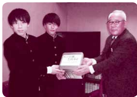
学校の生徒さんと先生方からもご協力いただきました。写真は光陵高校の生徒さんたち