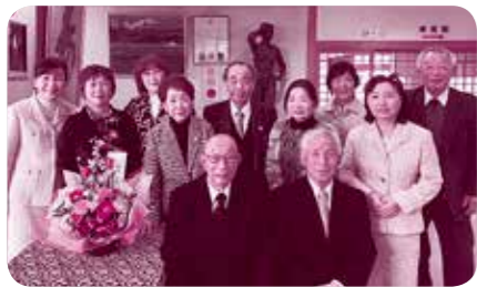
メンバーの皆さん(1/26受賞報告会にて)

「地域の中の交流を増やして元気で楽しく暮らせるように」という思いで、本橋の豊原地区を中心に活動をしている団体です。以前から行われていたいくつかの地域福祉活動を長く継続していきけるようにと組織化し、平成27年に設立されました。休耕田を利用した枝豆やハスの栽培、地域の清掃や除雪活動、高齢者の集いの場づくり、子どもから高齢者まで楽しめる人形劇の公演など、さまざまな活動を行っています。企画や運営をするメンバーも、その時々に参加する方たちも、笑顔で元気になれるような活動です。実際、メンバーの皆さんが集まる場所には元気な声や笑いがあふれています。