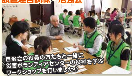
自治会の役員の方たちと一緒に 災害ボランティアセンターの役割を学ぶ ワークショップを行いました♪

他県の災害で、実際に災害ボランティアセンターに寄せられた、住民からの依頼や声をもとに、そのような場合にどう対応していくのがよいのか、参加者で話し合いました。