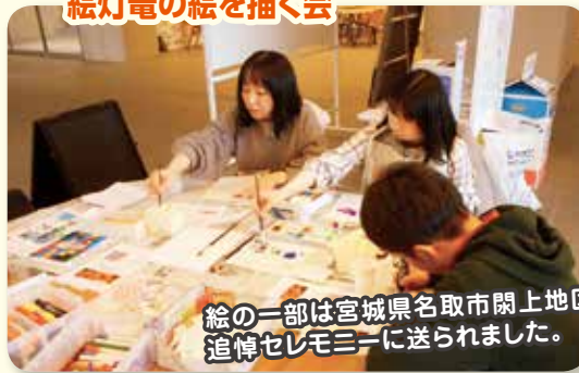
絵の一部は宮城県名取市関上地区で開催される 追悼セレモニーに送られました。

東日本大震災を風化させず復興への祈りを込めて、生涯学習施設「里仁館」、東北公益文科大学、市、市協協などが一緒に行っている活動です。