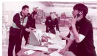
令和元年10月、丸森町災害ボランティアセンターにて1番左が酒田市社協から派遣された職員です。

酒田市社協からもこれまで、令和元年台風19号で被災した宮城県丸森町、平成30年大雨で被災した戸沢村など、被災地の災害ボランティアセンターへ職員を派遣しています。