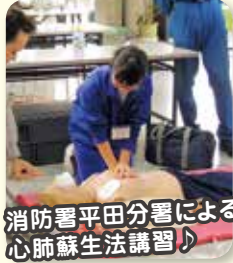
消防署平田分署による 心肺蘇生法講習♪