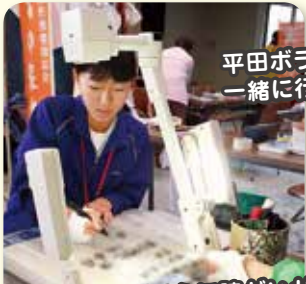
平田ボランティア連絡協議会と一緒に 行っているイベントです♪