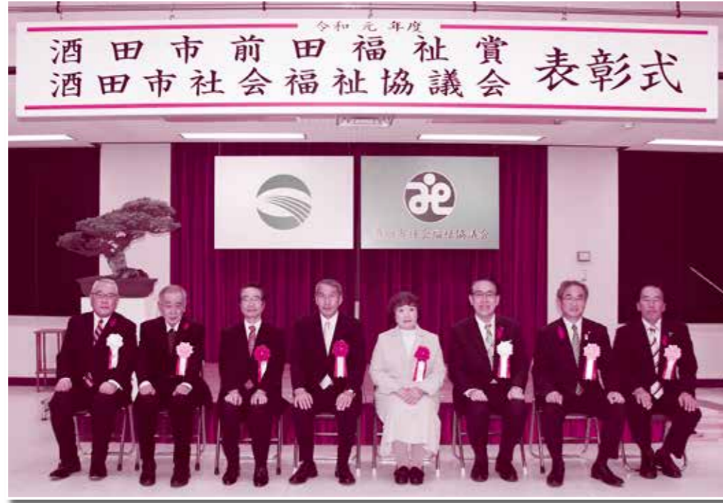
前田福祉賞を受賞した方々