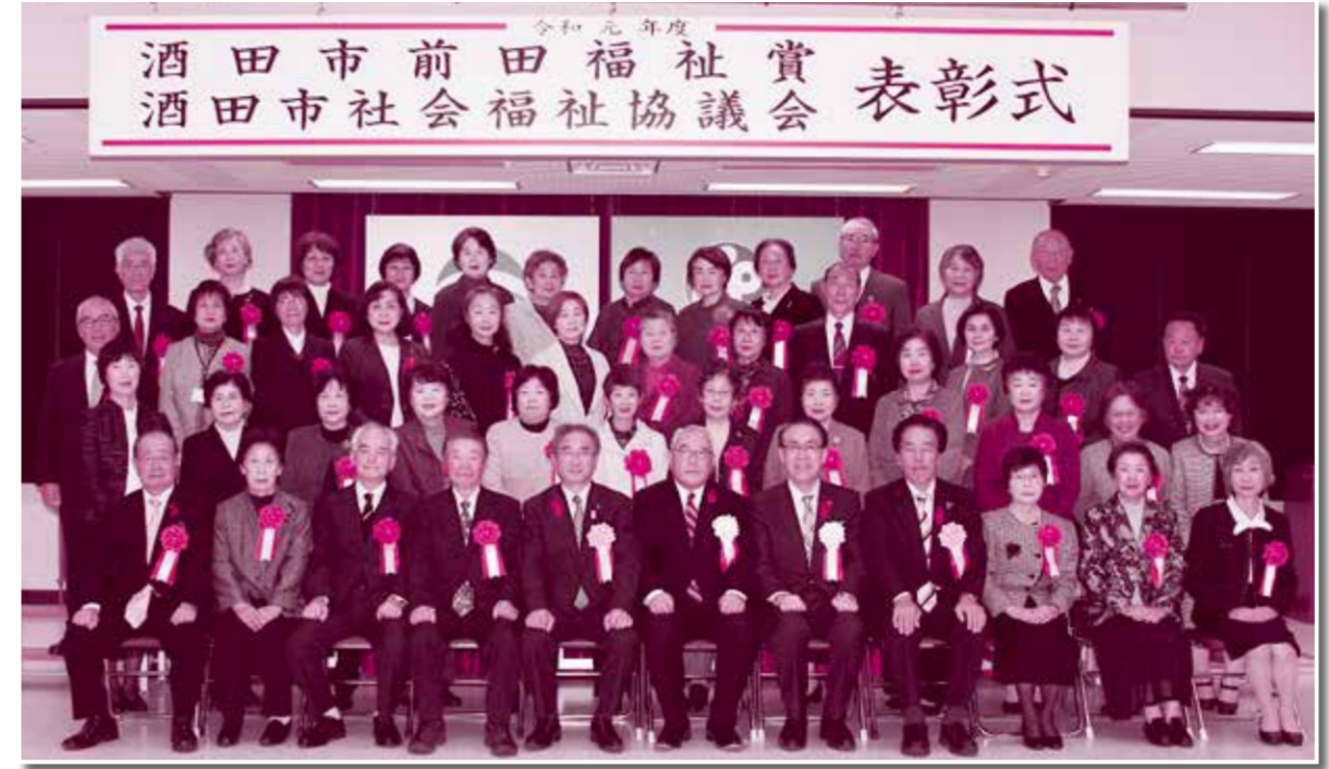
社協表彰を受賞した方々