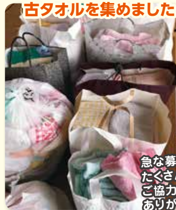
急な募集にもかかわらず たくさんの方が ご協力くださいました。 ありがとうございました!

宮城県大崎市と丸森町の災害ボランティアセンターに届けたほか、酒田からのボランティアバスによる被災地での活動に使わせていただきました。 ※タオルの受付は終了しています。