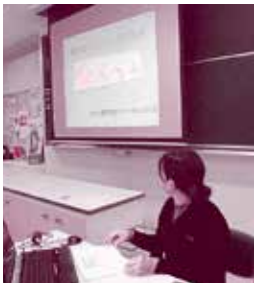
▲講座の様子▼ (かたばみ会)