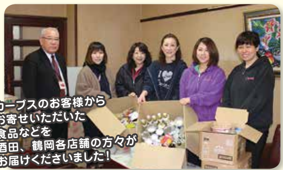
カーブスのお客様からお寄せいただいた食品などを酒田、鶴岡各店舗の方々がお届けくださいました!

市社協の実施するフードバンク事業では、余った食品等を企業や団体を通じて市社協にお寄せいただき、緊急食料支援として「今日明日食べるものがない」など困窮する世帯にお渡ししています。