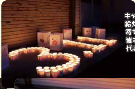
キャンドルづくりや絵灯ろうの絵を描いて寄せてくださった皆さまのお気持ちを代表して被災地へ...