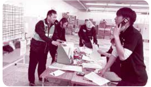
昨年10月、台風19号で被害を受けた宮城県丸森町の災害ボランティアセンターへの市社協職員派遣時の様子