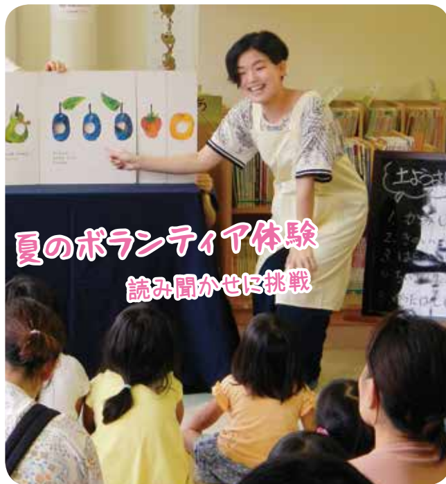
夏のボランティア体験 読み聞かせに挑戦

ボラポートさかたでは、これからも、市民の皆さんがボランティア活動や公益活動をはじめのきっかけづくり、活動をした人と必要としている人をつなげるなどの支援をしていきます。お気軽にご相談ください! (相談先は7ページ)