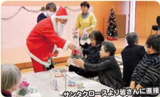
サンタクロースより皆さんに直接、プレゼントが渡されました!

プレゼント贈呈の他、よねさんの紙芝居、昼食、カラオケ等で楽しい時間を過ごされました(歳末たすけあい募金の助成により開催しています)。