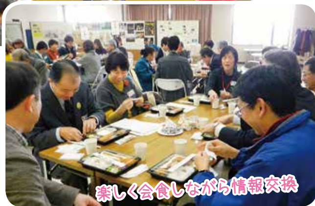
楽しく会食しながら情報交換