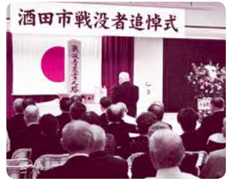
遺族会の協力をいただき、戦争を風化させることなく、平和の尊さを後世に伝えることなどを目的に開催します。(写真は昨年度)