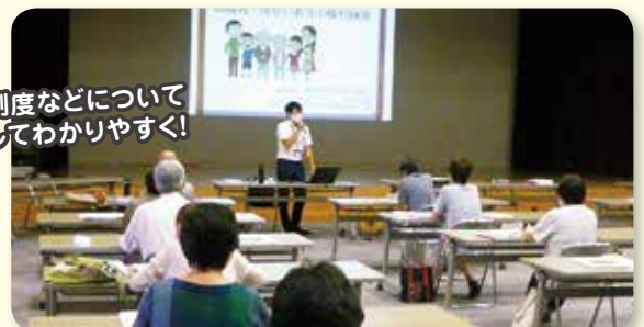
成年後見制度などについて 実例を通じてわかりやすく!