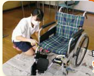
車イスをきれいに掃除中♪ 特別養護老人ホーム サン・シティ