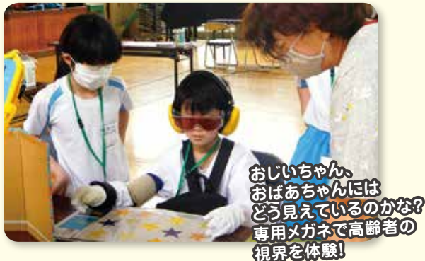
おじいちゃん、おばあちゃんにはどう見えているのかな？ 専用メガネで高齢者の視界を体験!

装具を装着して加齢に伴う身体の変化を疑似体験するものです。高齢者の気持ちや接し方等を学び、思いやりと優しさを持つ気持ちを育てるきっかけ作りとして、市内の小中学校で実施しています。