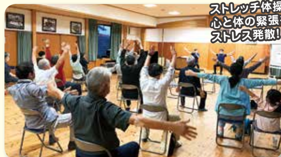
ストレッチ体操♪ 心と体の緊張をほぐして ストレス発散!