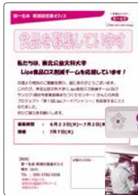
フードパントリーの 呼びかけチラシ

布し、食材提供にご協力いただいで います。その他にも酒田市へのマス クの寄贈や、清掃活動を行う酒田市 の美化サポーターにも登録を予定。 また、8月には酒田警察署とのコラ ボレーションで、地域安全見守り隊 を結成し ました。