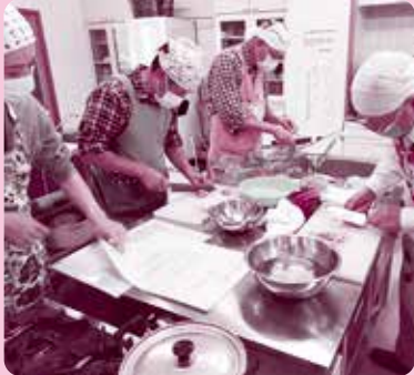
市社協は、地域主体の福祉活動を支援します! 松山支部「おとこかれーくらぶ(男の料理教室)」