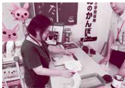
②金融機関で払い出し