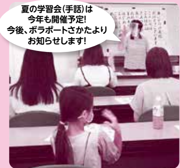
市社協は、地域の皆さんの福祉の学びを応援します! ポラポートさかた「夏の学習会(手話)」