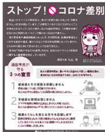
(詳しくは酒田市HPをご覧ください)

酒田市は、「市民が守る3つの宣言」を定め、新型コロナウイルスに関する人権侵害防止を呼びかけています。酒田市社会福祉協議会、ボラポートさかたでも、新型コロナウイルスによる差別、偏見のない酒田のまちを目指して活動していきます！みなさんもシトラスリボンプロジェクトの輪を広げてみませんか？