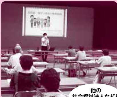
市社協は、地域への福祉の情報発信を進めます! 社会福祉法人「ふくし出前講座・ふくし共育出前講座」