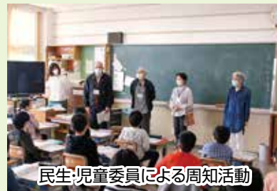
民生児童委員による周知活動