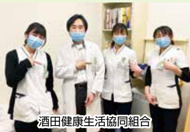
酒田健康生活協同組合