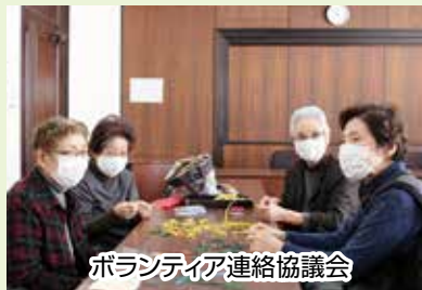
ボランティア連絡協議会