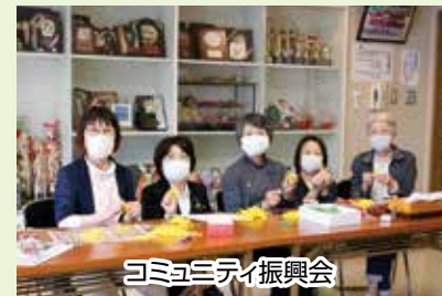
コミュニティ振興会