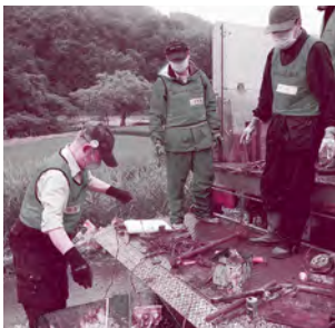
令和2年8月 大蔵村災害ボランティアの様子

被災者の困りごとに沿った活動をしていただくことで、被災者の生活再建につなげます。