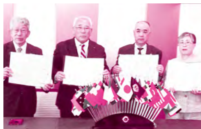
*写真撮影時のみマスクを外しています。

ライオンズクラブ国際協会と酒田市社協・庄内町社協・遊佐町社協は災害時における協力に関する協定書を締結しました。庄内北部地区（酒田市・庄内町・遊佐町）における災害発生時に、支援物資の調達、災害ボランティアセンターの運営支援等に協力していただきます。平時から、災害ボランティアセンター設置運営訓練を一緒に行う等、情報交換を行い有事に備えます。