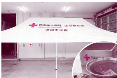
日赤山形県支部から寄贈