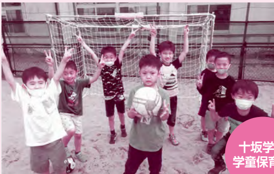
十坂学区 学童保育所