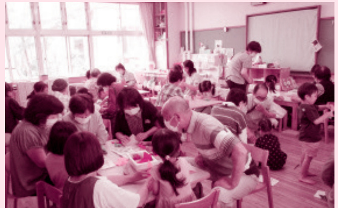
世代間交流(北新橋保育園)