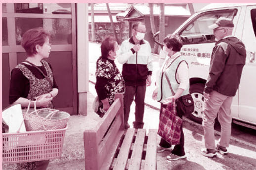
「日向おたすけ隊」による買い物支援

詳しい活動内容についてお知りになりたい方は、酒田市社協(8ページ)までお気軽にお問合せください。