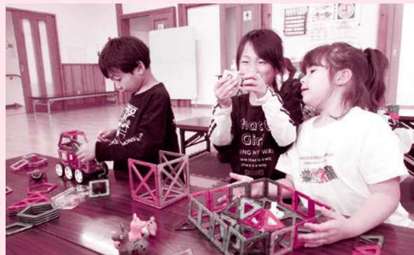
民間学童支援事業(亀ヶ崎学区第2学童保育所)