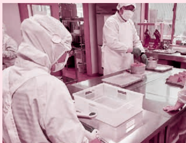
障がい福祉作業所支援事業(たぶの木)