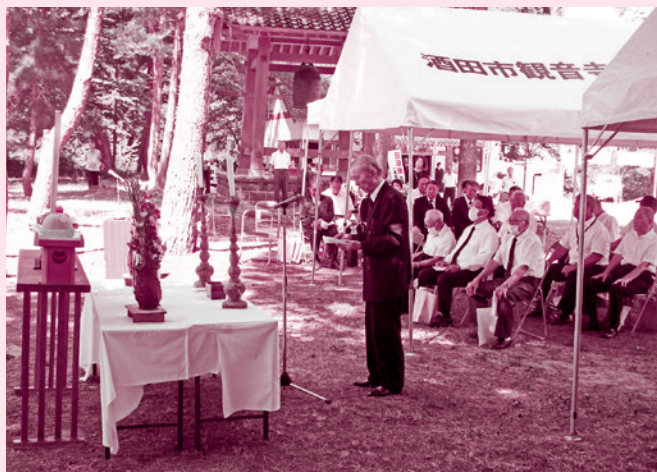
八幡戦没者慰霊祭(八幡遺族会)