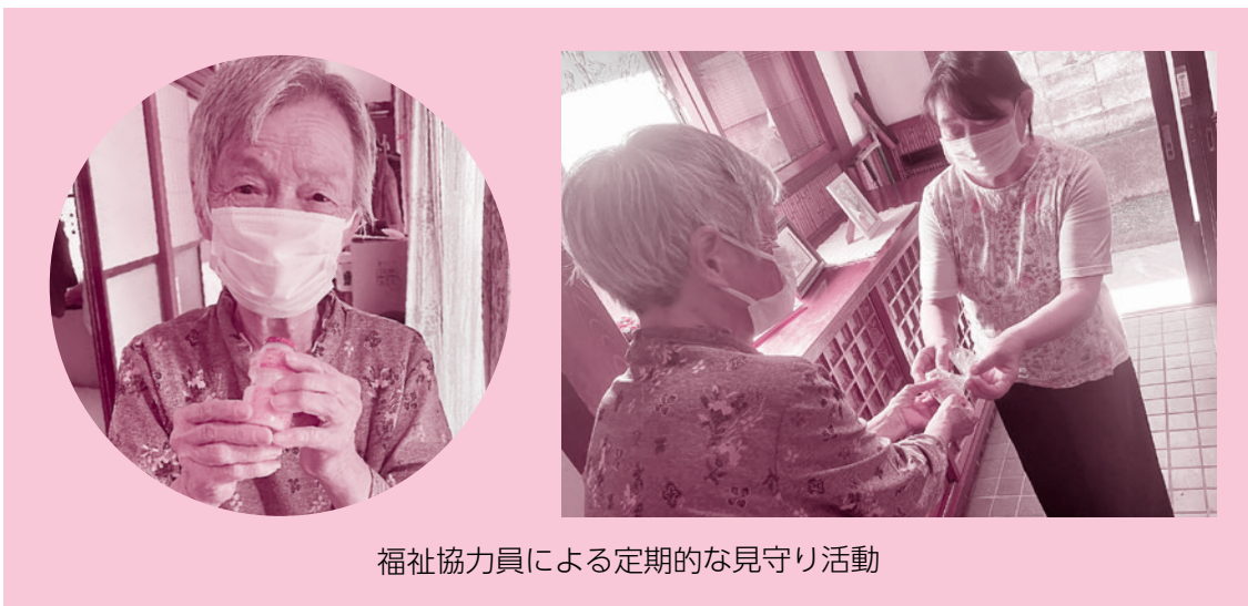
福祉協力員による定期的な見守り活動

泉学区社会福祉協議会は昭和62年に発足し、同年ふれあい給食事業を開始。平成4年からは民生委員によるヤクルト配布がスタートしました。それから30年以上経った現在も見守りネットワーク事業の一環として、毎週月曜日に福祉協力員が一人暮らしの高齢者や高齢者夫婦世帯にヤクルトを配布し、地域での見守り活動を行っています。見守りの対象者は自治会長と民生委員が協議しますが、特に地域のサロンや集まりなどにあまり参加せず、孤立・孤独傾向にある方、その恐れがある方を対象にすることを意識しており、毎週ヤクルトを届けながら、生活上の変化がないか確認し、地域での見守り活動を行っています。現在ヤクルト配布の対象者は9名となっております。今後も孤立や孤独を防ぐために、さりげない見守り活動を続けていきます！