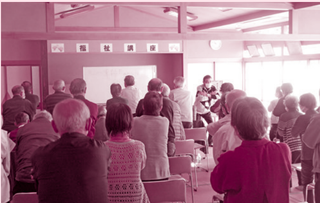
福祉講座(老人クラブ連合会松山支部)

子どもたちはお年寄りの温かさや優しさを感じ、お年寄りは子どもたちの元気と笑顔にふれることができました。お互いに楽しく穏やかな時間を過ごすことができました。 人形劇の鑑賞では、日頃テレビやスマートフォンの画面で見える映像とは違い、目の前で迫力があり、貴重な体験となりました。配分金は、人形劇鑑賞会に活用させていただきました。 ありがとうございました。