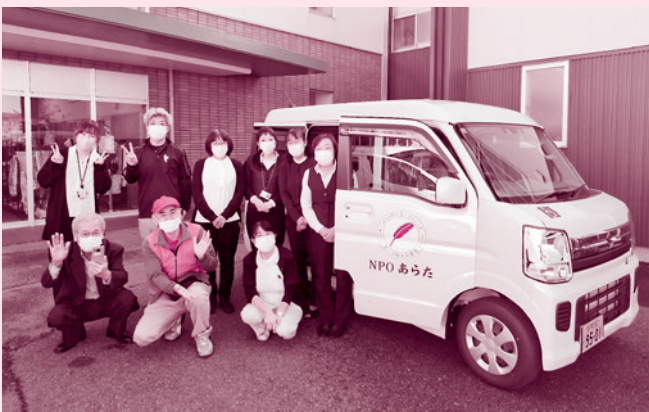
福祉車両購入助成(NPO法人あらた・NPO法人支援センターふれあい工房)