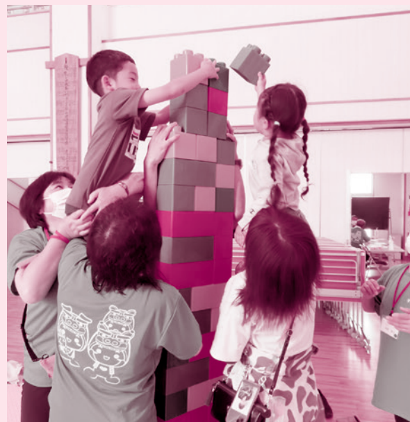
親子ふれあい広場(ちょうかい子育て応援団)